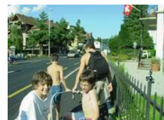
Für die Heimreise (320m laut TwixRoute) heuerten zwei faule Jungscharler zwei andere an, die sie im Anhänger zogen