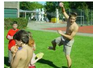
Hm, wurde der Fotograf nicht schon auf dem ersten Foto der letzten Ausgabe (SOLA 2007) bedroht?

Nach einigen lustigen Spielen (Völkerball mit Wasserballonen oder: alle haben einen Wasserballon und stehen im Kreis, auf „LOS“ schiessen alle oder: die Leiter werfen die Wasserballone in die Luft, wer einen fangen kann, darf danach die Leiter beschiessen) waren die Ballone unglaublich schnell verbraucht und der Nachmittag leider auch schon wieder vorbei!