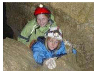
Zwei Höhlenforscher. Mehr Fotos auf unserer Homepage

Am 20. Oktober besuchten wir das „Nidlenloch“, eine Höhle mit 3km langen erforschten Gängen. Wir haben aber (laut Führer, es wollte es niemand so recht glauben), nur 300 Meter zurückgelegt! Wie auch immer, erschöpft genug waren wir sowieso als wir wieder rauskrochen und in die Sonne blinzelten! Mehr (und vor allem grössere) Bilder sind auf unserer Homepage zu bestaunen!