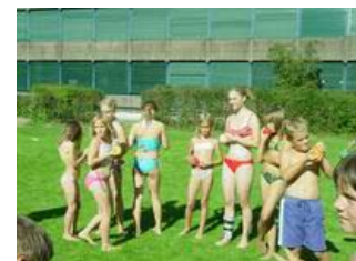
Einige Spieler mit Wasserballonen können die nächste Runde kaum erwarten!