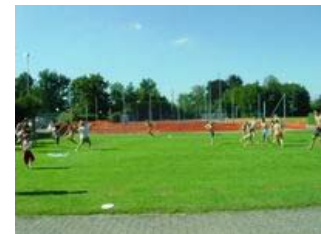
Eine etwas abgewandelte Variante des Völkerballs: Beide Gruppen haben einen Haufen Wasserballone, damit versuchen sie die andere Gruppe nass zu machen!